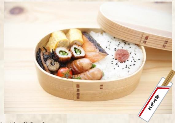
しゃしん いめーじ

①~⑥について、5月6日(土曜日)までに 電話・メール・FAXで連絡してください。