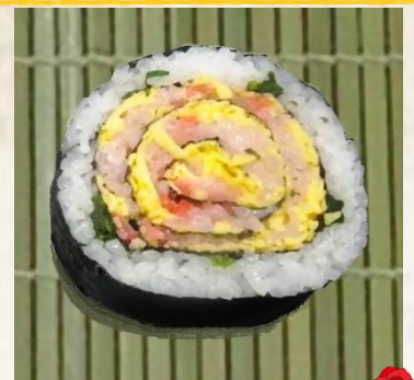
Rose Rolled Sushi

*You can download the application form from YIEA's homepage.