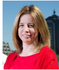
マリアデルコリセオ・ゴンサレス=イスキエルド

ペルー、スイス、アラブ首長国連邦にて大使を歴任。2012年からはスペイン外務協力省外務長官の要職を務める。2014年12月より駐日スペイン大使。