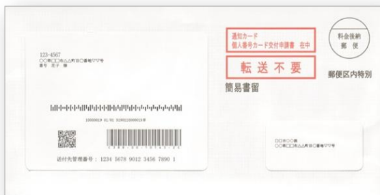
【Ficha de notificación】 (Frente)