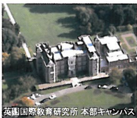
英国国際教育研究所 本部キャンパス

IIELは英国で初めて体系的な日本語教育を開講した国際教育研究機関です。英国のGCSEやAレベルを実施する公的試験センターや学会の本部として機能、また附属のランゲージ・センターでは、英国政府国際文化交流機関ブリティッシュ・カウンシル認定の各種外国語コースを開講しています。