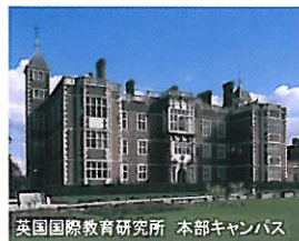
英国国際教育研究所 本部キャンパス

英国国際教育研究所は、日本語の国家統一試験を実施する英国の公的試験センターや学会の本部として機能しています。また附属のランゲージ・センターでは、英国政府国際文化交流機関ブリティッシュ・カウンシル認定の各種外国語コースを開講しています。