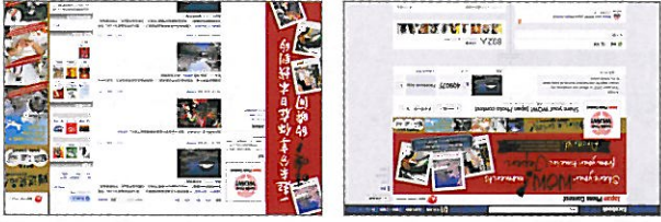
Official Facebook page