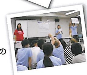
平和についてディスカッション

Discussion 平和、社会問題などについて、英語で議論をします。仲間とだからこそできる本音のディスカッションは、このプログラムの醍醐味です。