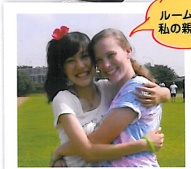
ルームメイトは私の親友です!

アクティビティー例: Dance Party・Talent Show・Sports Day・Japanese Festival・ American Day・Halloween・BBQ・Prom... and more!