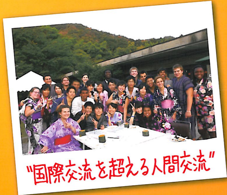
"国際交流を超える人間交流"