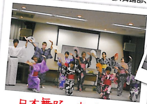
日本舞踊の部活発表

Japanese Culture Club 学校の部活動のように、全参加者が日本文化に関連したクラブに所属します。日本の参加者は、クラブ活動計画を作成したり事前準備を行い、アメリカの生徒に日本文化を習得してもらうことを目指します。 クラブ例: 茶道部、華道部、着付け部、舞踊部、剣道部、柔道部 等