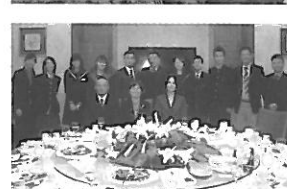
掲載の写真は平成22年度の山東省への青少年訪問団派遣のものです。

※(公財)山口県国際交流協会は、山東省人民対外友好協会と平成17年1月に青少年交流を中心とする友好交流協定を締結し、平成18年度から相互交流を実施しています。