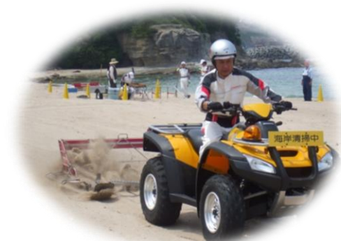
ビーチクリーナーによる清掃も行います。

申込方法 裏面の様式に必要事項を記入の上、FAX 又はE-mail等により申し込んでください。