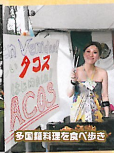
多国籍料理を食八歩き

スペイン語から直訳すると「サルサの島」。サルサは、スペイン語でソース・ドレッシングのこと。国籍・人種・年齢などの壁を越え、文化を共有し合いながら、お互いの違い(異文化)、持ち味を理解する。そして、ドレッシングを作るように互いのスパイスを混ぜ合わせてみたら。。。きっと新しい何か生まれるはず。