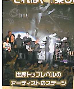
世界トップレベルのアーティストのステージ