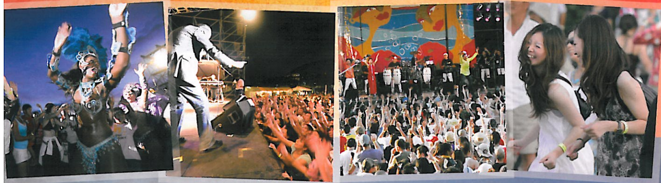
Photos: Isla de Salsa 2009

8/7 Sat. & 8 Sun. Open 12:30 / Start 13:00 at シーサイドももち・地行浜 (ヒルトン福岡シーホーク 横) Seaside Momochi, Jigyo-hama