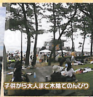
子供から大人まで木陰でのんびり