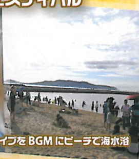
ライブをBGMにビーチで海水浴